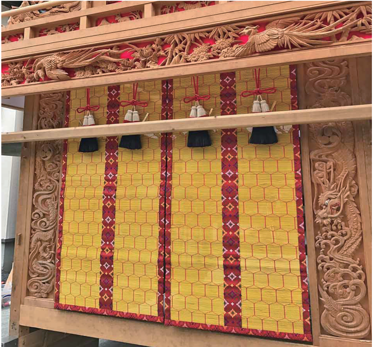
祭り屋ユーミー様 アトリエ悠様