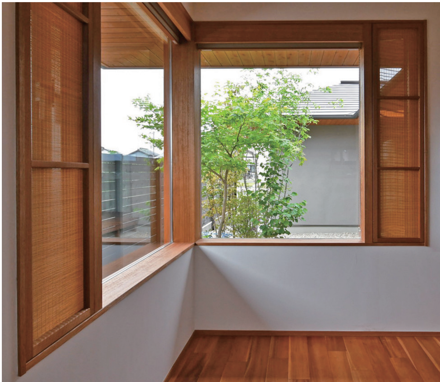
設計：株式会社サン工房 様